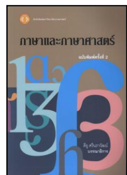
ภาษาและภาษาศาสตร์ 410 ด483ก