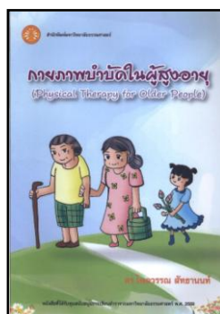
ภาพถ่ายบำบัดในผู้สูงอายุ 610.820846 พ994ก