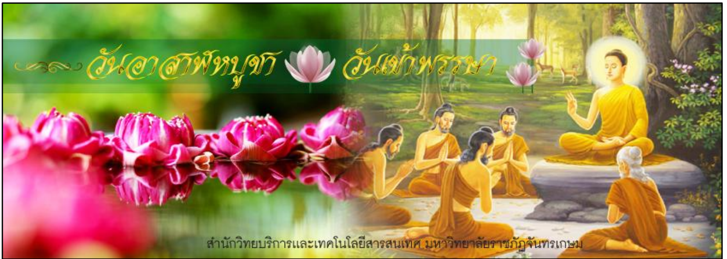
สำนักวิทยบริการและเทคโนโลยีสารสนเทศ มหาวิทยาลัยราชภัฏจันทรเกษม