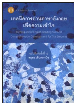
เทคนิคการอ่านภาษาอังกฤษเพื่อความเข้าใจ 428.43 ส316ท